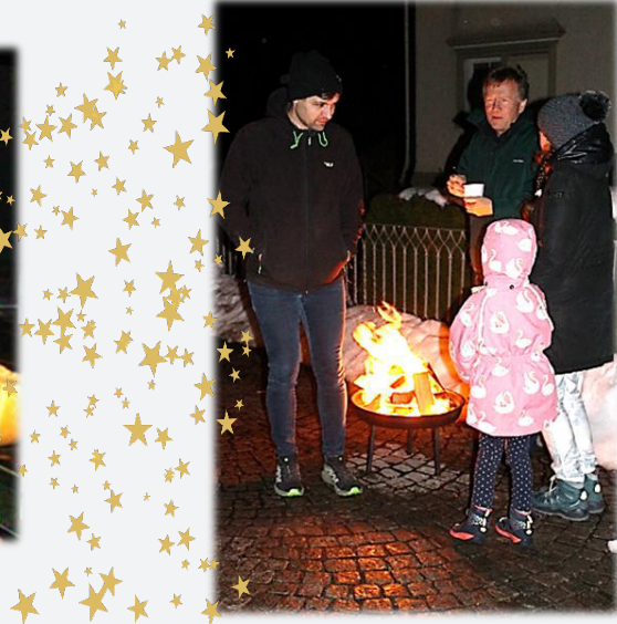
Es wurde kalt gegen Abend und die Feuerschale wärmte und erzeugte eine behagliche, adventliche Stimmung.